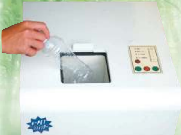
安全設計の投入口