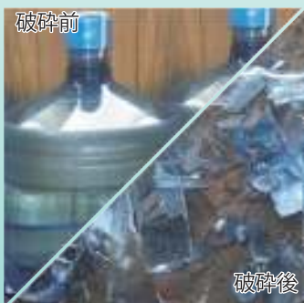
ポリカーボネイト